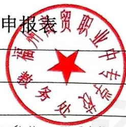
2024级专业人才培养方案验收申报表